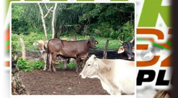
Comiendo sal Nutrilopez 5:26 P. M.